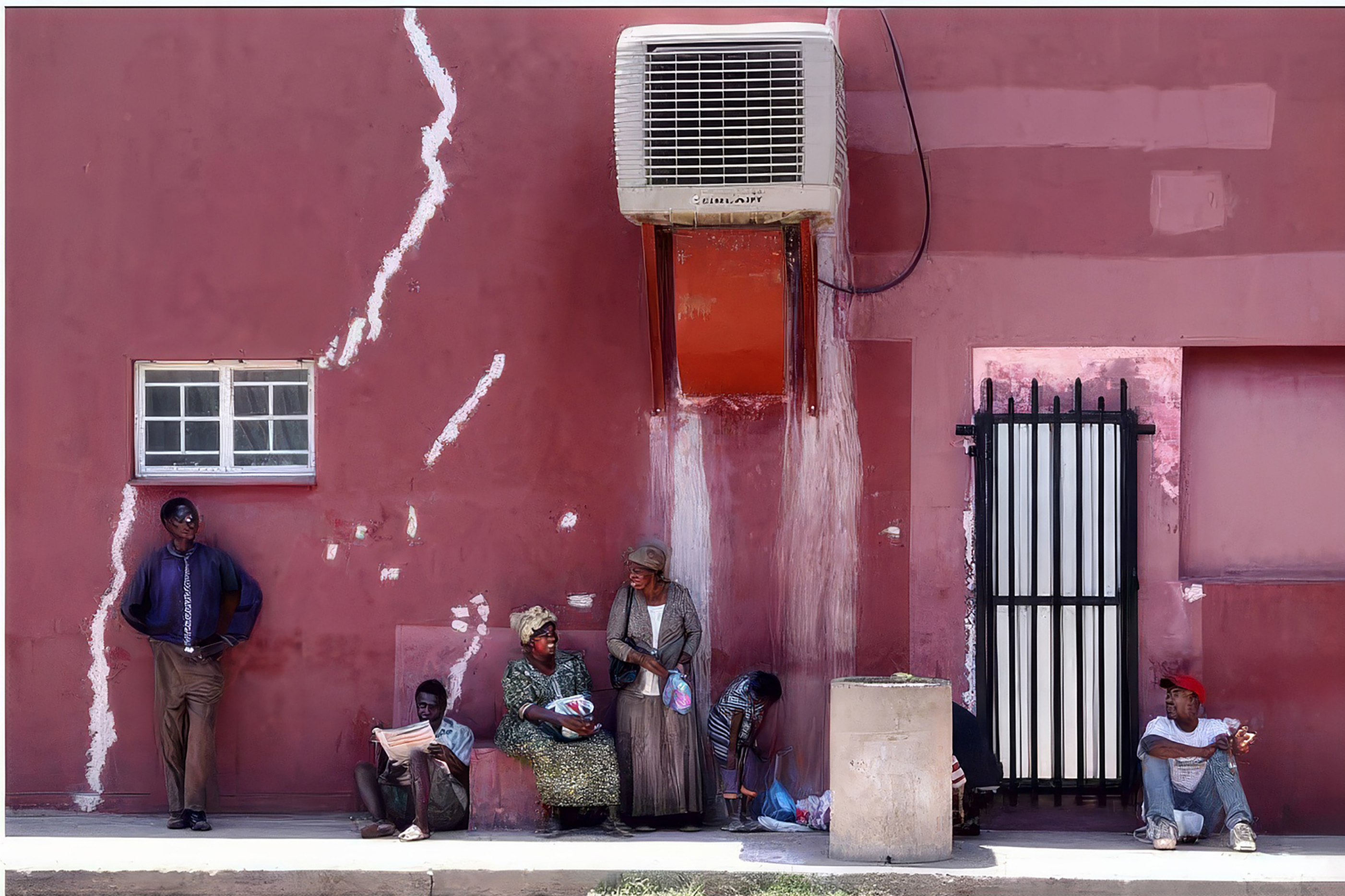
Ⓢ 'Bij een rondreis door Namibië konden we bij een korte stop in het stadje Durjo wat inkopen doen. We kwamen haastig uit de supermarkt, want de bus stond op vertrekken, toen ik in m'n ooghoek dit tafereel zag van wachtende mensen. Alles en iedereen staat op de juiste plaats. Ik heb er maar één foto van kunnen maken, maar die was wel meteen goed. De foto blijft me boeien.'