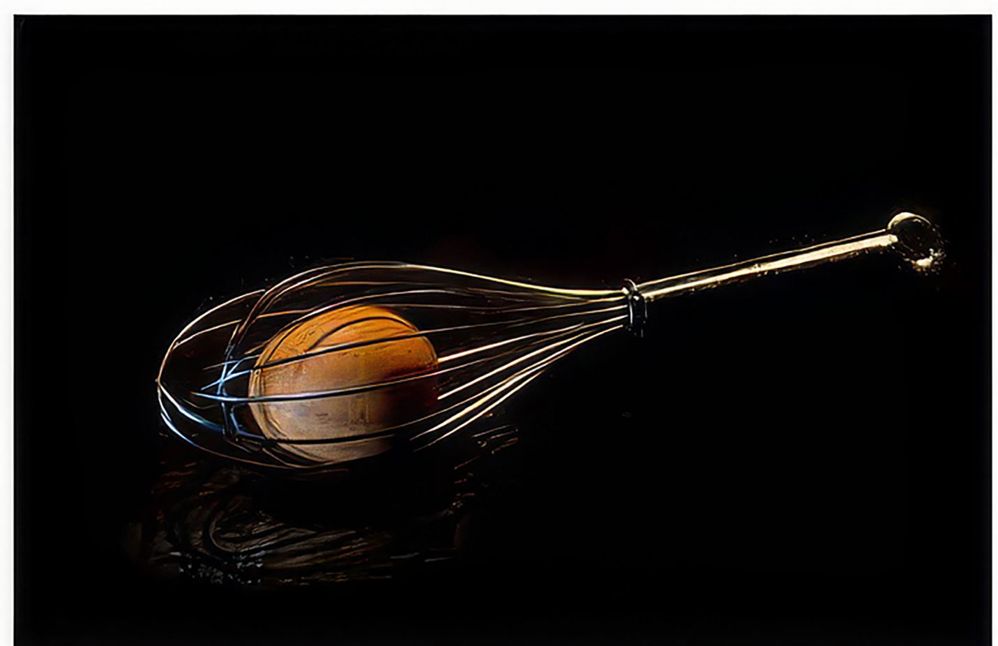
📷 'Wat voorbeelden van mijn macro's met dingen die je in huis hebt. Er borrelt een ideeetje op. Ik zet de spullen neer op mijn donkere keukenblad, richt er een lampje op, zet de camera met 100mm objectief op statief en maak een foto. Ik verdraai voor meer foto's het voorwerp of het lampje nog een paar keer, zet het statief wat lager of hoger en dan ben ik wel klaar. De hele operatie duurt ongeveer een kwartier, hooguit een half uur.'