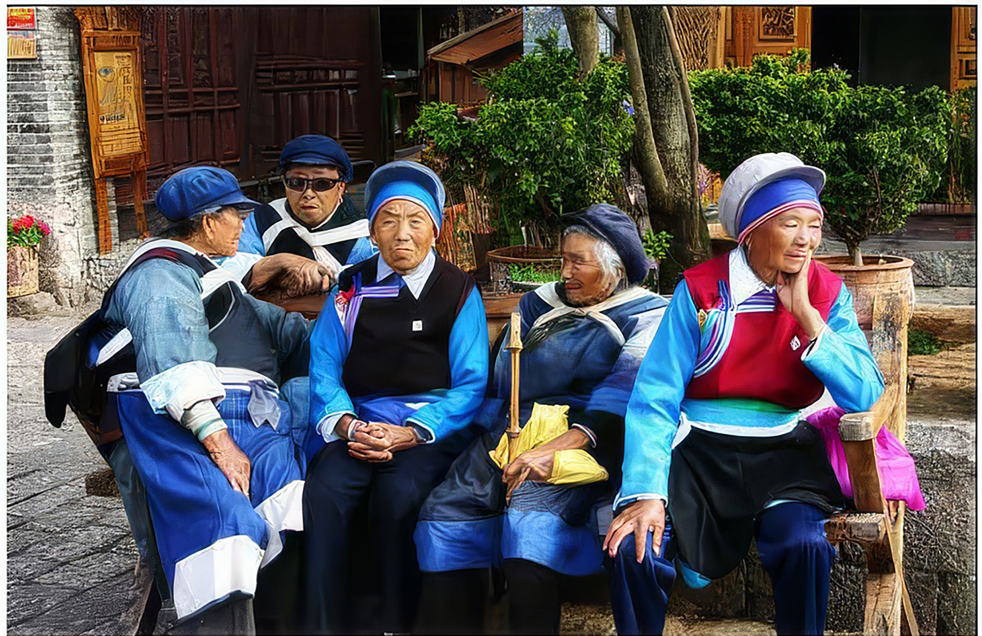
📷 'Op rondreis door China zaten deze dames in de klederdracht van de Naxi-stam op een pleintje in Lijiang. Wat opvalt is dat er geen een dezelfde kant op kijkt. Slechts één dame kijkt mij aan.'